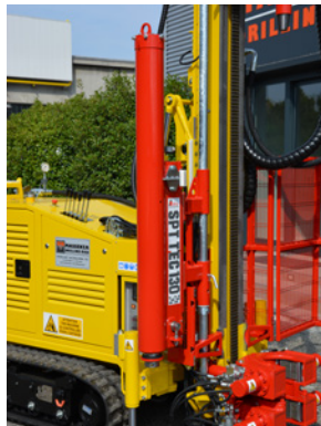
Penetrometro SPT SPT penetrometer Pénétrmètre SPT SPT penetrationsmesser Penetrometro SPT Пенетрометр SPT