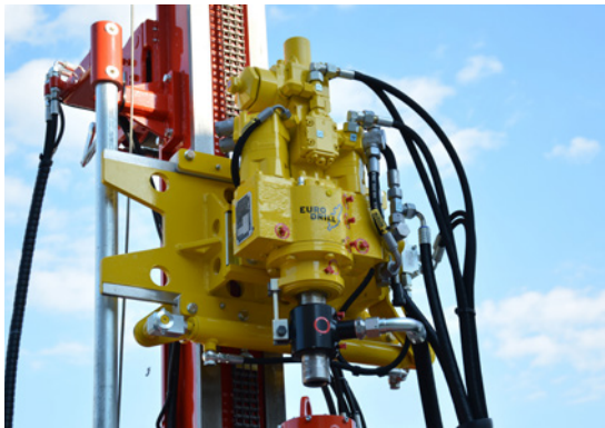
Testa roto-percussione Hydraulic drifter Tête roto percussion Hydraulikhammer Cabeza con martillo hidráulico Гидромолот