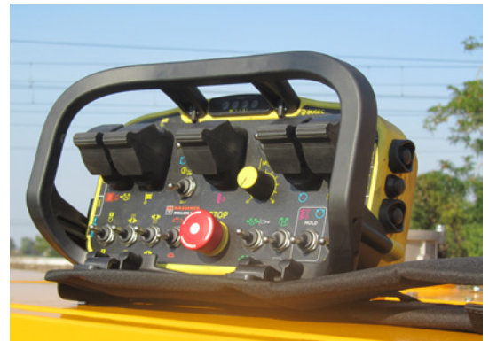
Radiocomando Radio remote control Télécommande Mando a distancia Fernbedienung Пульт радиоуправления